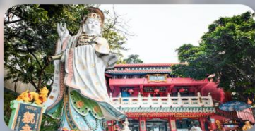
เจ้าแม่กวนอิมรีฟัลส์เบย์