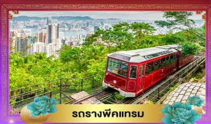
รถรางพิคแกรม