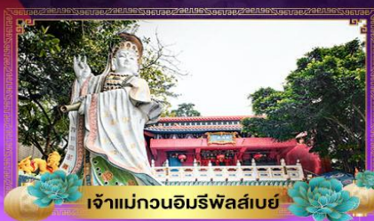
เจ้าแม่กวนอิมรพีลาลัย