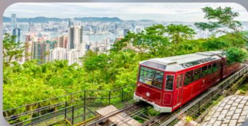
รถรางพิคทแรม

THE LUXE MANOR HOTEL หรือเทียบเท่า 4-5 ดาว