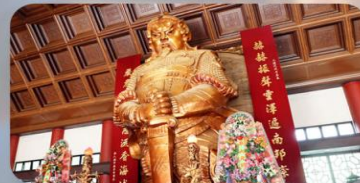
วัดแซกทมิว