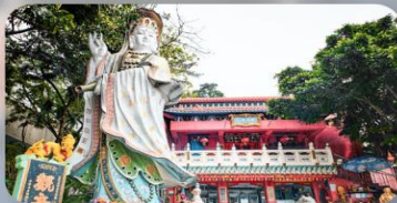
เจ้าแม่กวนอิมรพิลส์เบย์