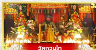
วัดกวงโถ