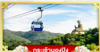
กระเช้าองปิง