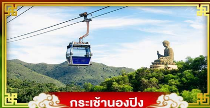
กระเช้านองปิง