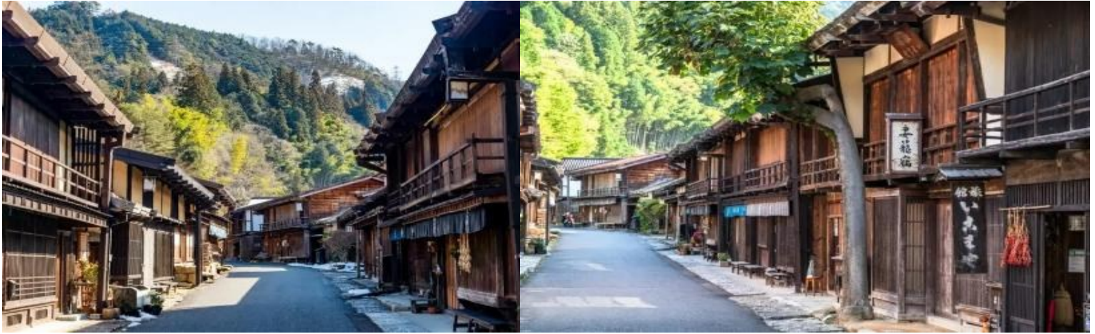
นำท่านเข้าสู่ที่พัก IKENOTAIRA HOTEL หรือเทียบเท่า

ค่ำ รับประทานอาหารค่ำ ณ ห้องอาหารของโรงแรม