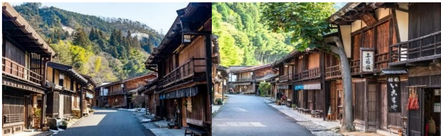
นำท่านเข้าสู่ที่พัก IKENOTAIRA HOTEL หรือเทียบเท่า

ค่ำ รับประทานอาหารค่ำ ณ ห้องอาหารของโรงแรม