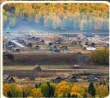
หมู่บ้านเหมอู่

สวรรค์ใบไม้เปลี่ยนสี เยือนคานาสือแดนฝัน มหัศจรรย์หมู่บ้านเหมอู่ เคอเคอทัวไห่อัศจรรย์ภูผาหิน