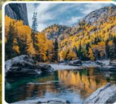
เคอเคอทัวไห่