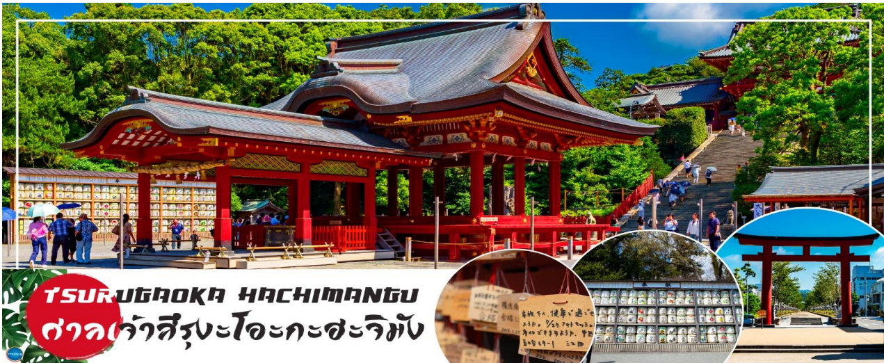
TSURUGAOKA HACHIMANGU ศาลเจ้าสี่รุเงโอะกะสะจิมัง

08.00 น. เดินทางถึง ท่าอากาศยานนานาชาตินาริตะ ประเทศญี่ปุ่น นำท่านผ่านขั้นตอนการตรวจคนเข้าเมืองและศุลกากร เรียบร้อยแล้ว (เวลาที่ญี่ปุ่น เร็วกว่าเมืองไทย 2 ชั่วโมง กรุณาปรับนาฬิกาของท่านเพื่อความสะดวกในการนัดหมายเวลา) ***สำคัญมาก!! ประเทศญี่ปุ่นไม่อนุญาตให้นำอาหารสด จำพวก เนื้อสัตว์ พืช ผัก ผลไม้ เข้าประเทศ หากฝ่าฝืนมีโทษปรับและจับ