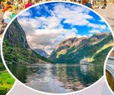
ล่องเรือ "Nærøyfjord"