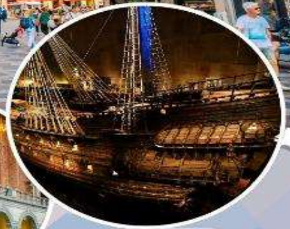
เข้าชม "พิพิธภัณฑ์เรือวาซา"