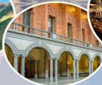
เข้าชมศาลาว่าการ กรุงสต็อกโฮล์ม