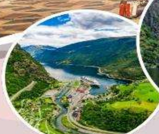
นั้งรดไฟสายโรแมนติก "Flamsbana"