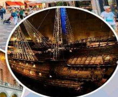
เข้าชม "พิพิธภัณฑ์เรือวาซา"