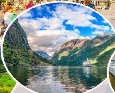
ล่องเรือ "Nærøyfjord"