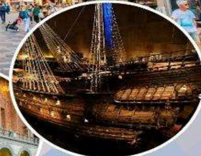
เข้าชม "พิพิธภัณฑ์เรือวาซา"