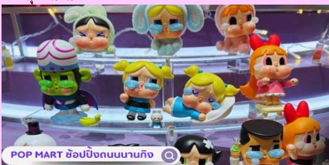
POP MART ช้อปปีงถนนนานกิง