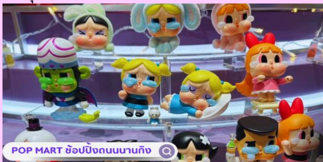
POP MART ช้อปปีงถนนนานกิง