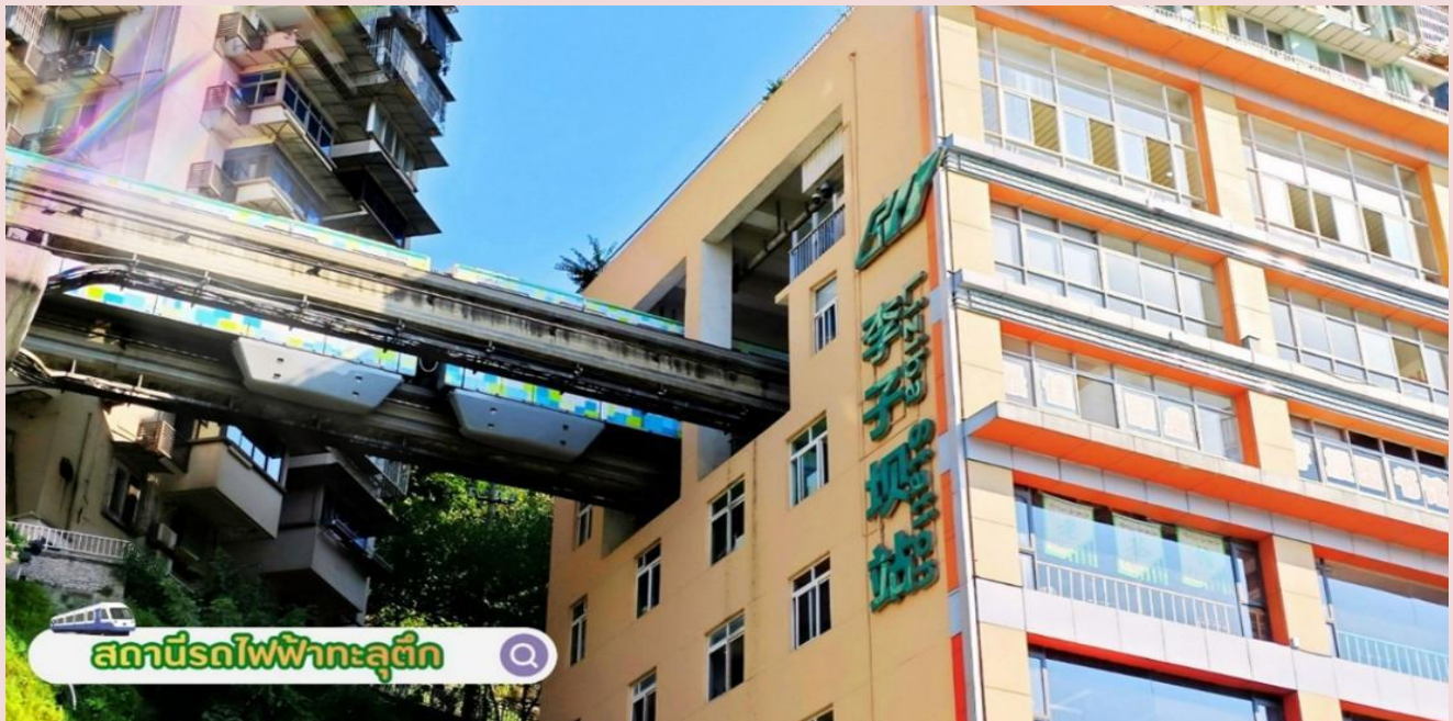
สถานีรถไฟฟ้าทะเลตึก

นำท่านสู่ มหาศาลาประชาชนฉงชิ่ง (Chongqing Great Hall of the People) **ชมด้านนอก** คือสัญลักษณ์สำคัญของเมืองฉงชิ่ง เป็นอาคารขนาดใหญ่ที่มีสถาปัตยกรรมจีนอันงดงาม ผสมผสานศิลปะแบบราชวงศ์หมิงและชิง โดยได้รับแรงบันดาลใจจากหอฟ้าเทียนถาน (Temple of Heaven) ในปักกิ่ง ภายในจุคนได้กว่า 4,000 คน ใช้เป็นที่ประชุมสภาผู้แทนราษฎรและโรงละคร มีความโดดเด่นที่โดมกลางขนาดใหญ่สีแดง-เขียว ตั้งอยู่ใกล้กับจัตุรัสประชาชน และเป็นจุดหมายยอดนิยมที่นักท่องเที่ยวต้องไปเยือนเพื่อชมสถาปัตยกรรมและบรรยากาศเมือง