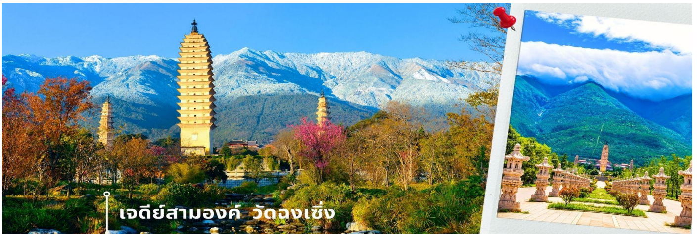
เจดีย์สามองค์ วัดจงเซิง

จากนั้นผ่านชม เจดีย์สามองค์ สัญลักษณ์ของเมืองต้าหลี่ ตั้งอยู่ภายใน วัดจงเซิง (Chongsheng Temple) วัดเก่าแก่ที่สร้างขึ้นเมื่อศตวรรษที่ 9 นับว่าเป็นหนึ่งในเจดีย์ที่สูงที่สุดในประเทศจีน อีกทั้งยังมีความศักดิ์สิทธิ์เป็นอย่างมาก ว่ากันว่าเป็นหนึ่งในสิ่งก่อสร้างเพียงไม่กี่แห่งที่ไม่ถูกทำลายจากเหตุการณ์แผ่นดินไหวในเมืองต้าหลี่เมื่อปี ค.ศ. 1925 จึงกลายเป็นสถานที่เคารพศรัทธาของชาวต้าหลี่เป็นอย่างมาก