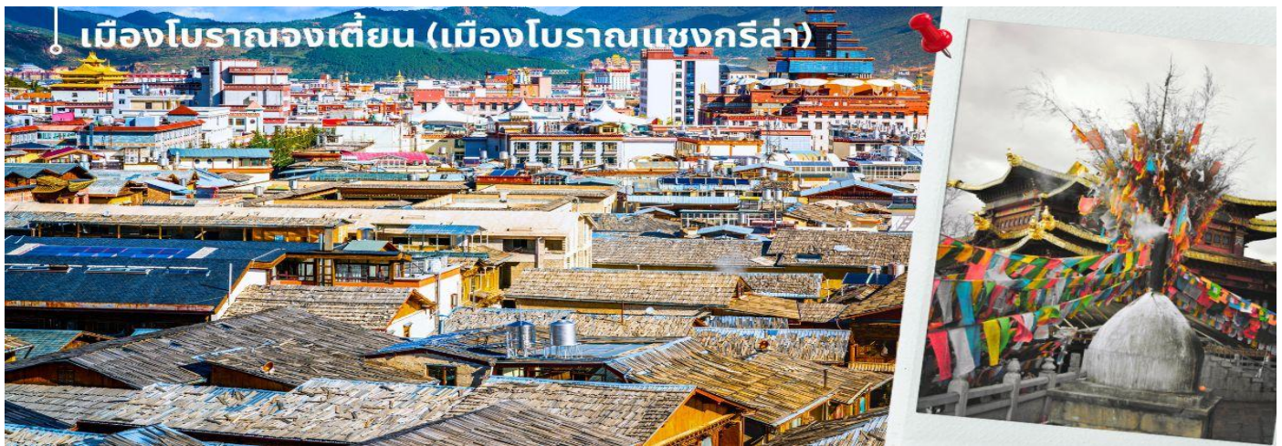
เมืองโบราณจงเตี้ยน (เมืองโบราณแซงกรีสล่า)

นำท่านชม เมืองโบราณจงเตี้ยน (เมืองโบราณแซงกรีสล่า) ตั้งอยู่ในเขตปกครองตนเองชนชาติทิเบต ตี๋ซิ่ง ทางตะวันตกเฉียงเหนือของมณฑลยูนนาน ที่ราบสูงทางภาคตะวันตกเฉียงใต้ของประเทศจีน มีชนชาติส่วนน้อย 25 ชนชาติอาศัยกันอยู่ อาทิ ชนชาติทิเบต ลีซอ น่าซี ไป และอี เป็นต้น ศูนย์รวมของวัฒนธรรมชาวทิเบต ลักษณะคล้ายชุมชนเมืองโบราณทิเบต ซึ่งเต็มไปด้วยร้านค้าของคนพื้นเมือง ร้านขายสินค้าที่ระลึกมากมาย