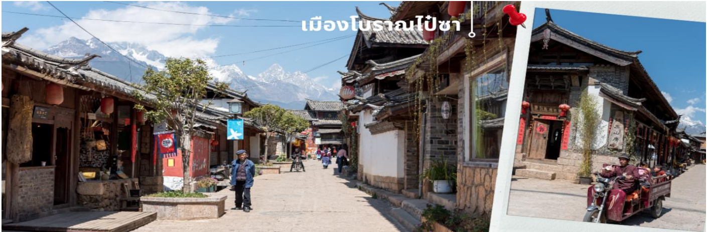
เมืองโบราณไปซา

นำท่านเดินทางไปยัง เมืองโบราณไปซา ตั้งอยู่ทางตอนเหนือของลี่เจียง ได้รับเงาอันยิ่งใหญ่ของภูเขาหิมะมังกรหยก หมู่บ้านไปซาเคยเป็นศูนย์กลางแห่งแรกของชาวหน่าซี และเป็นบ้านเกิดของราชวงศ์มู่ จึงอัดแน่นไปด้วยประวัติศาสตร์ และวัฒนธรรมแบบดั้งเดิมที่ยังคงหลงเหลืออย่างสมบูรณ์ ไม่ว่าจะเป็นบ้านไม้โบราณจากยุคราชวงศ์หมิงและชิง ลวดลายศิลปะที่ได้รับอิทธิพลจากพุทธทิเบต เต่า และขงจื้อ ภายในหมู่บ้านยังมีถนนเก่าที่เป็นส่วนหนึ่งของ “เส้นทางสายชาและม้า” เส้นทางค้าขายโบราณที่เคยคึกคักมาก่อน ปัจจุบันเต็มไปด้วยร้านค้าหัตถกรรม งานปักผ้า งานไม้ และบรรยากาศเงียบสงบเหมาะแก่การเดินเล่น ชมวิถีชีวิตชาวบ้านแบบเรียบง่าย