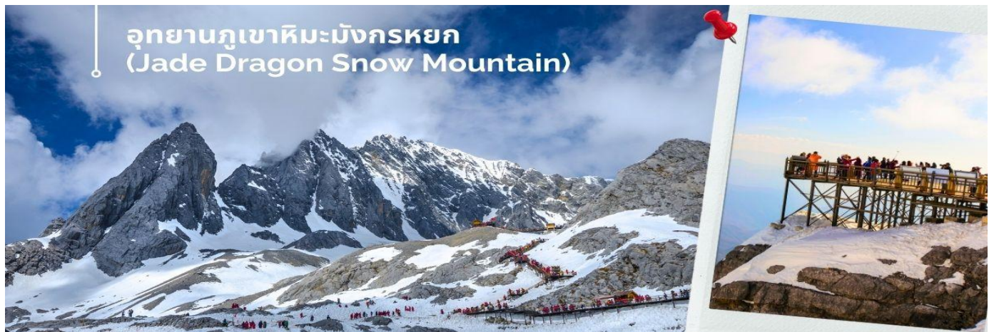
อุทยานภูเขาหิมะมังกรหยก (Jade Dragon Snow Mountain)

เช้า ๑๐๑ รับประทานอาหารเช้า ณ ห้องอาหารโรงแรม (9) นำท่านชม อุทยานภูเขาหิมะมังกรหยก (Jade Dragon Snow Mountain) (รวมค่ากระเช้ากระใหญ่ ขึ้น-ลง) สู่จุดชมวิว ภูเขาหิมะมังกรหยก สูงจากระดับน้ำทะเล 4,506 เมตร ตั้งอยู่ในเขตปกครองตนเอง Yulong Naxi เมืองลี่เจียง มณฑลยูนนาน เป็นหนึ่งในสถานที่ท่องเที่ยวระดับ 5A เป็นอุทยานธรณีธารน้ำแข็งแห่งชาติ ครอบคลุมพื้นที่ 415 ตารางกิโลเมตร และภูเขามีสลักษณะเป็นลูกคลื่นและมีลักษณะคล้ายมังกรเงินที่บินได้ตั้งนั้นจึงได้ชื่อว่าภูเขาหิมะมังกรหยก ยอดเขาหลัก ชานจีไต่ว์ อยู่สูงจากเหนือระดับน้ำทะเล 5,596 เมตร ล้อมรอบด้วยเมฆและหมอกตลอดทั้งปี เป็นยอดเขาบริสุทธิ์ที่ไม่มีใครพิชิตได้ ภูเขาหิมะมังกรหยกเป็นหนึ่งในจุดชมวิวที่มีชื่อเสียงในลี่เจียงและเป็นภูเขาศักดิ์สิทธิ์ในใจของชาวนาซี มียอดเขาทั้งหมด 13 ยอด อุดมไปด้วยทรัพยากรการท่องเที่ยวทางธรรมชาติ และสามารถแบ่งออกเป็นพื้นที่หิมะ ธารน้ำแข็ง ทุ่งหญ้าอัลไพน์ ภูมิทัศน์ป่าดึกดำบรรพ์ ฯลฯ ภูเขาที่ปกคลุมด้วยหิมะเต็มไปด้วยความงดงาม ทรงพลัง และยังดูน่าเกรงขาม เมื่อฤดูกาลเปลี่ยนไป ดอกอาซาเลียที่เบ่งบานในระดับความสูงต่างๆ ทำให้เกิดทิวทัศน์ที่สวยงามที่สุดของภูเขาที่ปกคลุมด้วยหิมะ พื้นที่ที่สวยงาม ได้แก่ หมู่บ้าน Yushui, สวนกลาเซียร์, Blue Moon Valley และสถานที่ท่องเที่ยวอื่นๆ