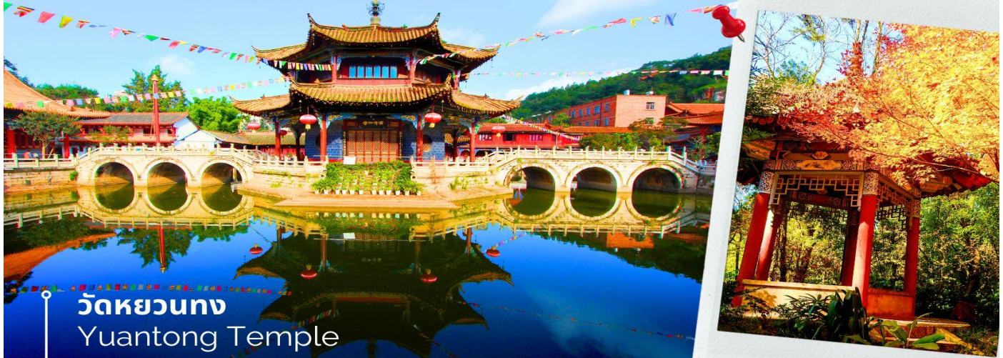
วัดหยวนทง Yuantong Temple

เช้า 100 รับประทานอาหารเช้า ณ ห้องอาหารโรงแรม (15) นำท่านชม วัดหยวนทง (Yuantong Temple) วัดแห่งนี้เป็นวัดที่ใหญ่และเก่าแก่ที่สุดในเมืองคุนหมิง สร้างมาตั้งแต่สมัยราชวงศ์ถัง มีอายุยาวนานประมาณ 1,200 กว่าปี การสร้างวัดแห่งนี้จะแปลกตากว่าวัดอื่นในจีน เพราะปกติแล้วการสร้างวัดของจีนส่วนมากจะต้องสร้างอยู่บนภูเขา แต่วัดหยวนทงสร้างวัดต่ำกว่าภูเขา โดยวิหารจะอยู่ต่ำที่สุดเนื่องจากวัดแห่งนี้ไม่ได้สร้างขึ้นเพื่อเป็นวัดโดยตรง แต่เคยเป็นศาลเจ้าแม่กวนอิมมาก่อน