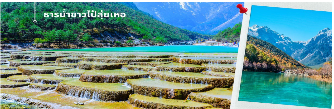
ธารน้ำขาวไปสู่เยหอ

นำท่านชม ธารน้ำขาวไปสู่เยหอ หรือ ทะเลสาบไปสู่เยหอ (รวมค่าบริการรถแบริดเดอร์) ทะเลสาบสีเทอร์ควอยซ์ตัดกับวิวต้นไม้ ท่ามกลางขุนเขาแห่งหุบเขาพระจันทร์สีน้ำเงิน ฉากของภูเขาหิมะมังกรหยก มีน้ำตกหินปูนชั้นบันไดขนาดเล็กลดหลั่นลงมาอย่างสวยงาม น้ำที่ไหลผ่านหุบเขานี้คือน้ำที่ละลายจากหิมะบนยอดเขาหิมะมังกรหยก เนื่องจากจุดนี้มีทิวทัศน์ที่สวยงามมีฉากหลังคือภูเขาหิมะมังกรหยกมีน้ำตกและแม่น้ำกึ่งทะเลสาบจึงเป็นที่นิยมของนักท่องเที่ยวช่างภาพและคู่รักเป็นอย่างมาก อิสระเก็บภาพประทับใจตามอัธยาศัย