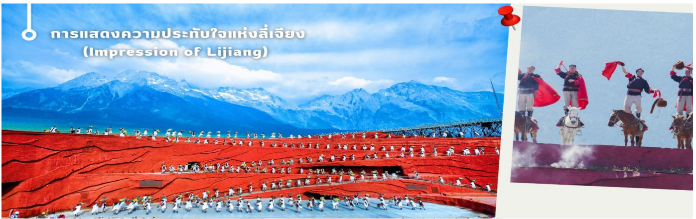
การแสดงความประทับใจแห่งลี่เจียง (Impression of Lijiang)

และที่ไม่ควรพลาดนั่นคือ การแสดงความประทับใจแห่งลี่เจียง (Impression of Lijiang) การแสดงที่คัดเลือกนักแสดงชนเผ่าท้องถิ่นกว่า 500 ชีวิต มาร่วมกันร้อง เล่น เต้นรำ และบอกเล่าวิถีชีวิตของชาวนาซี (naxi) ชาวพื้นเมืองของลี่เจียง ที่มีความเชื่อว่าพวกเขาคือลูกหลานของสวรรค์และธรรมชาติอันยิ่งใหญ่ ด้วยบรรยากาศเมฆสวย ฟ้าใส รวมเข้ากับดนตรีพื้นเมืองและการแสดงที่เป็นเอกลักษณ์ได้อย่างลงตัว ซึ่งกำกับการแสดงโดยจางอ๋อโหมว ผู้กำกับฝีมือเยี่ยมมีชื่อเสียงก้องโลก ซึ่งจางอ๋อโหมว ได้เนรมิตเวทีการแสดงกลางแจ้งขึ้นมาบนความสูงกว่า 3,000 เมตร เหนือระดับน้ำทะเล โดยมี “ภูเขาหิมะมังกรหยก” เป็นฉากหลังสุดอลังการ