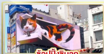
ซูปป์ชินจูกุ