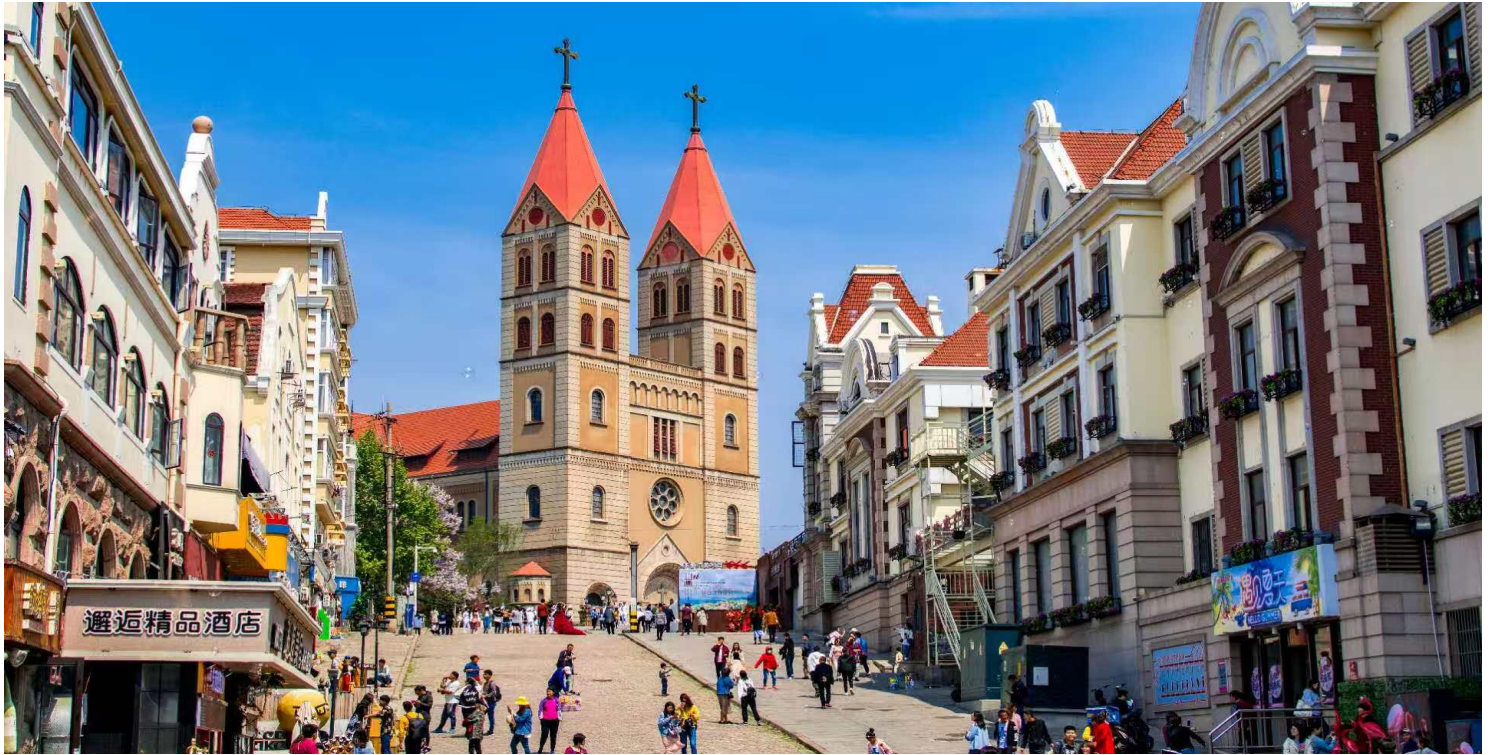
มุมมองสุดปังของชิงเต่า เลี้ยวหยูซาน (Xiaoyushan Park) สวนสาธารณะบนเนินสีเขียวที่สูงกว่า 60 เมตรเหนือระดับน้ำทะเลด้านบนมี ศาลาจีนทรงแปดเหลี่ยม 3 ชั้น สูงเด่นเป็นเอกลักษณ์ สามารถขึ้นไปชมวิวเมืองชิงเต่าได้แบบรอบทิศ มองเห็นแลนด์ดังของเมืองชิงเต่า