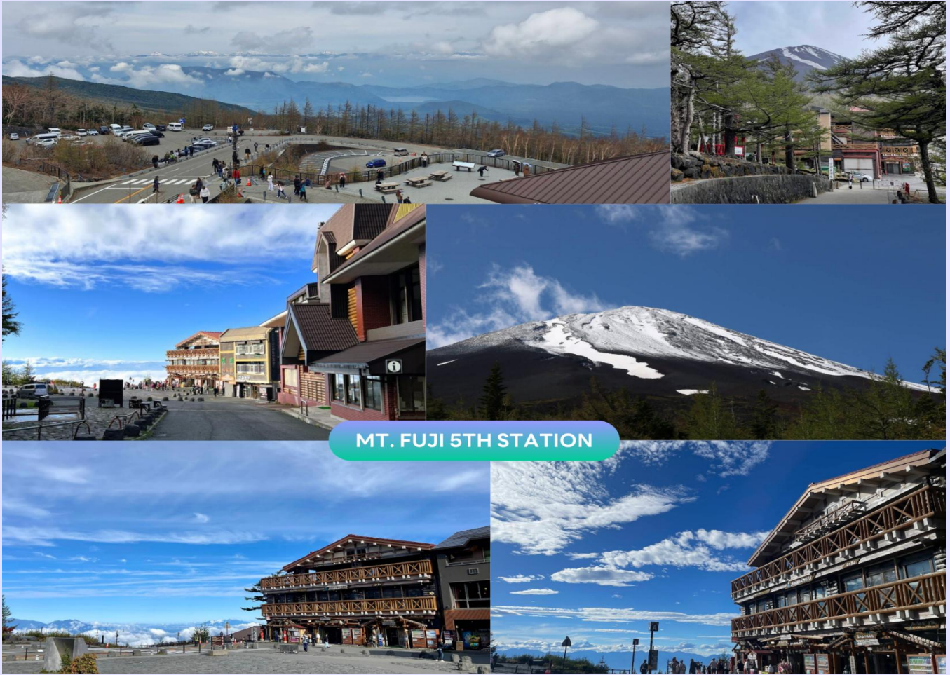
MT. FUJI 5TH STATION

จากนั้นนำท่านสู่ ภูเขาไฟฟูจิ ชั้น 5 (Mt. Fuji 5th Station) ให้ท่านสัมผัสภูเขาไฟฟูจิอย่างใกล้ชิดที่บริเวณชั้นที่ 5 ซึ่งเป็นจุดที่รถโดยสารสามารถขึ้นไปจอดได้ ภูเขาไฟฟูจินั้นเป็นภูเขาไฟที่สูงที่สุดในญี่ปุ่น และยังเป็นสัญลักษณ์ของประเทศญี่ปุ่นอีกด้วย ท่านสามารถชมความงามของภูเขาไฟฟูจิได้ตลอดทั้งปี เพราะในแต่ละฤดูภูเขาไฟฟูจิจะมีความงดงามที่แตกต่างกัน อีกทั้งยังเป็นภูเขาไฟที่สวยงามไม่ว่าจะมองจากมุมไหนก็ตาม **หมายเหตุ : การขึ้นชมภูเขาไฟฟูจิชั้น 5 นั้น ขึ้นอยู่กับสภาพอากาศ**