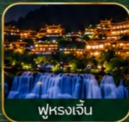
ฟูหรงเจิ้น