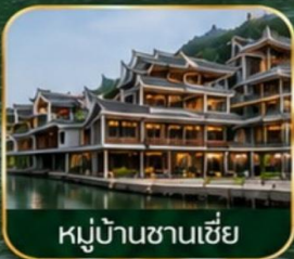
หมู่บ้านซานเซี่ย