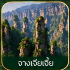
จางเจียเจีย