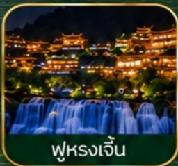
ฟูหรงเจิ้น