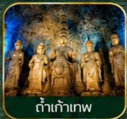
ดำเก้าเทพ