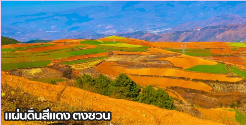
แผ่นดินสีแดง ตงชวน

นำทุกท่านเดินทางสู่ เมืองตงชวน (DONGCHUAN) หรือที่รู้จักกันในชื่อ หงถู่ตี้ ซึ่งแปลว่าแผ่นดินสีแดง เมืองตงชวนตั้งอยู่ทางทิศตะวันออกเฉียงเหนือของมณฑลยูนหนาน มีภูมิประเทศเป็นทิวเขาสลับซับซ้อน ชาวพื้นเมืองส่วนใหญ่ประกอบอาชีพปลูกข้าวสาลี มันสำปะหลัง ผักต่างๆ และดอกไม้มานานานาพันธุ์ และตงชวน ยังถือว่าเป็นจุดท่องเที่ยวไฮไลท์อีกหนึ่งแห่งของคุณหมิง เป็นจุดที่นักท่องเที่ยวนิยมแวะมาเก็บภาพบรรยากาศที่สวยงาม นำท่านชม ภูเขาเจ็ดสีแห่งตงชวน หรือ แผ่นดินสีแดง (DONGCHUAN RED LAND) ตั้งอยู่ในเขตเมืองตงชวน ทางตอนเหนือของคุณหมิง มีภูมิประเทศเป็นทิวเขาสลับซับซ้อนและ