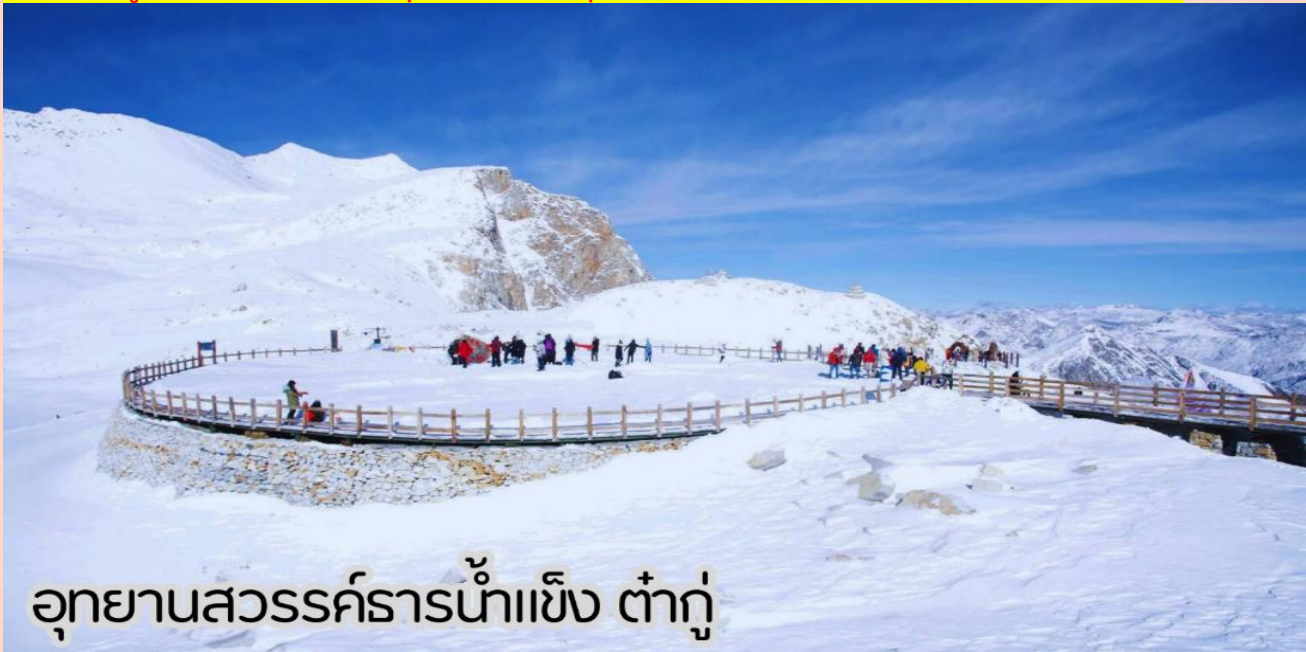
อุทยานสวรรค์ธารน้ำแข็ง ต่ากู่

(หิมะขึ้นอยู่กับสภาพอากาศ และจุดท่องเที่ยวในอุทยานอาจมีการเปลี่ยนแปลงตามความเหมาะสม)