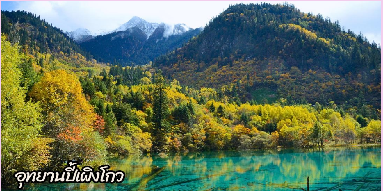
อุทยานปีนังโกว

นำท่านชม ทะเลสาบราชามังกร หรือ หลงหวังไห่เป็นหนึ่งในไฮไลต์สำคัญของอุทยานปีนังโกวทะเลสาบแห่งนี้มีน้ำใสสะอาดราวกระจก สะท้อนภาพภูเขาหิมะและป่าไม้โดยรอบอย่างงดงาม นอกจากนี้ยังมี ทะเลสาบปิ่นหยางซึ่งเป็นอีกหนึ่งจุดเด่นที่ดึงดูดนักท่องเที่ยวเช่นกันถือเป็นจุดที่เหมาะสมสำหรับการเดินเล่นพักผ่อนและดื่มด่ำกับธรรมชาติอันเจิบสงบ อีกไฮไลต์คือ น้ำตกไปหลง เป็นอีกหนึ่งสถานที่สำคัญภายในอุทยานปีนังโกว น้ำตกนี้มีความสูงและสวยงาม โดยกระแสน้ำจะไหลลงมาจากหน้าผาเหมือนม่านน้ำสีขาว เปรียบเสมือน "มังกรขาว" ที่กำลังพุ่งลงมาจากสวรรค์น้ำตกไปหลงถือเป็นจุดถ่ายภาพยอดนิยมเพราะล้อมรอบไปด้วยธรรมชาติอันเขียวชอุ่มและบรรยากาศสดชื่น นอกจากนี้ เสียงน้ำตกที่ตั้งกังวานช่วยสร้างความผ่อนคลาย