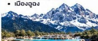
พัก MAN GE HOTEL หรือเทียบเท่า 4 ดาว