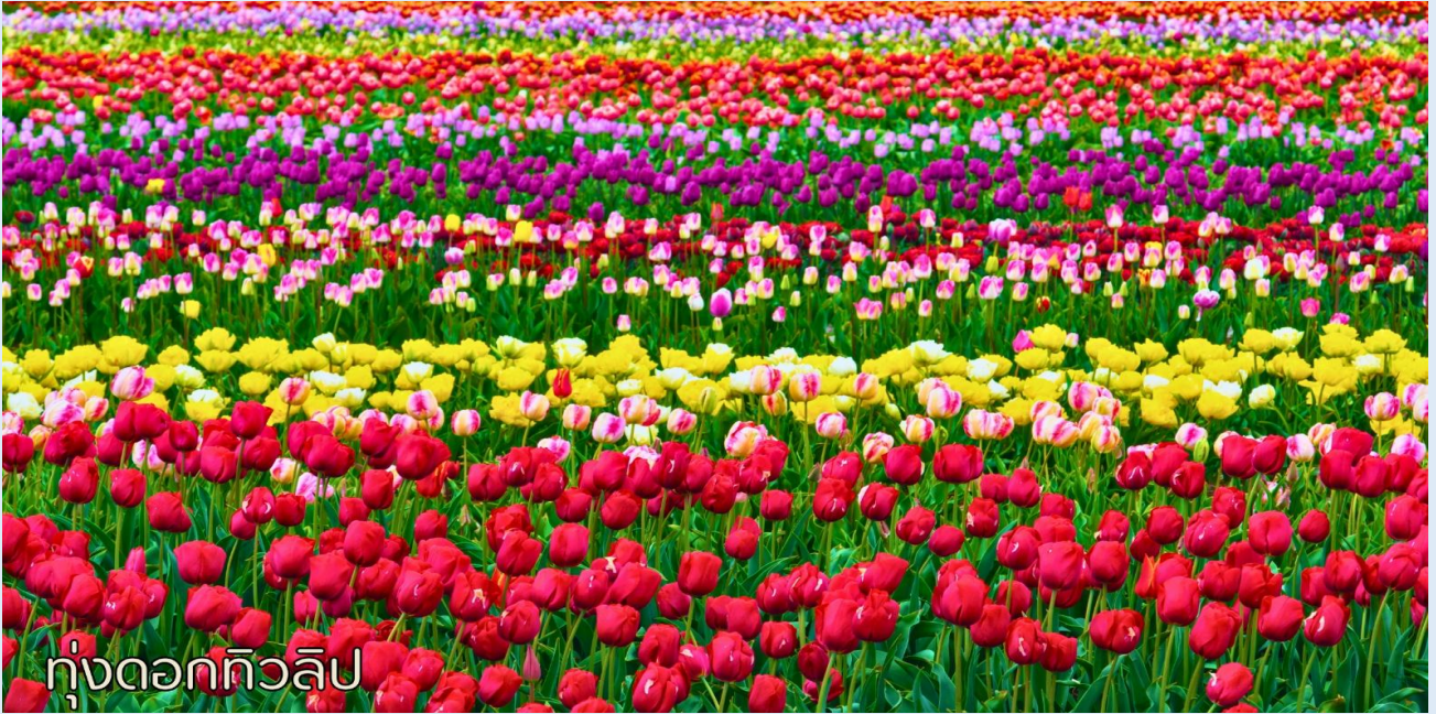
ทุ่งดอกทิวลิป

**หมายเหตุ: โปรแกรมชมดอกไม้ในช่วง ณ วันเดินทางดังกล่าวหาก ดอกไม้ยังไม่บานหรืออาจจะร่วงหล่น..ทั้งนี้ขึ้นอยู่กับสภาพอากาศของแต่ละปีทางบริษัทไม่การันตี และไม่สามารถกำหนดการบานของดอกไม้ได้ทางบริษัทฯ ขอสงวนสิทธิ์ปรับเปลี่ยนรายการท่องเที่ยว อื่นทดแทนนะคะ รบกวนท่านโปรดทราบและทำความเข้าใจค่ะ**