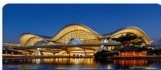
พัก JIN JIANG HOTEL หรือเทียบเท่า 4 ดาว