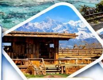
กาแฟ Yun Di An