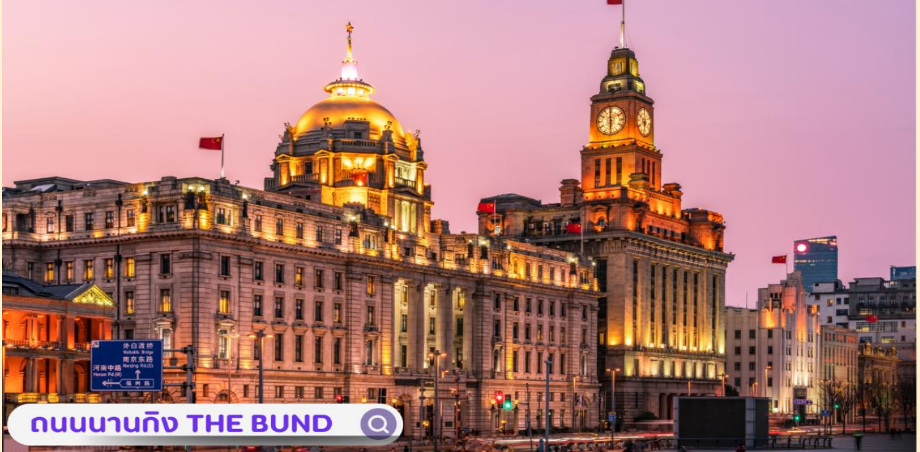
ถนนนานกิง THE BUND

จากนั้นอิสระท่านเพลิดเพลินที่ ถนนนานกิง(NANJING ROAD) เป็นย่านช้อปปิ้งเก่าแก่ที่สุดของเซี่ยงไฮ้ เป็นตลาดซื้อขายของกันคึกคักตั้งแต่ทศวรรษ 1920 ตั้งอยู่ฝั่งผู้ซีกินพื้นที่ยาวตั้งแต่ฝั่งตะวันตกของ “เดอะ บันด์” ถึง “พีเพิลส์ สแควร์” เป็นแหล่งช้อปปิ้งสินค้าแบรนด์เนมจากทั่วโลก และยังเป็นศูนย์รวมร้านค้าและร้านอาหารอีกมากมาย และพลาดไม่ได้กับนักจุ่มอาร์ททอยอย่าง แบรินด์ POP MART GLOBAL FLAGSHIP STORE ร้านขายของเล่นที่เป็นที่โด่งดังในขณะนี้ไม่ว่าจะ LABUBU MOLLY SKULLPANDA และอย่างอื่นอีกมากมาย ให้ท่านได้เลือกลุ้นกันอย่างสนุกสนาน