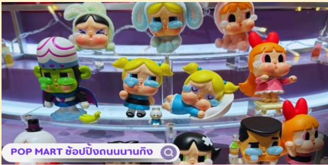
POP MART ซ้อปบิงกบนานกิง