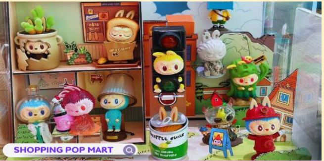
SHOPPING POP MART