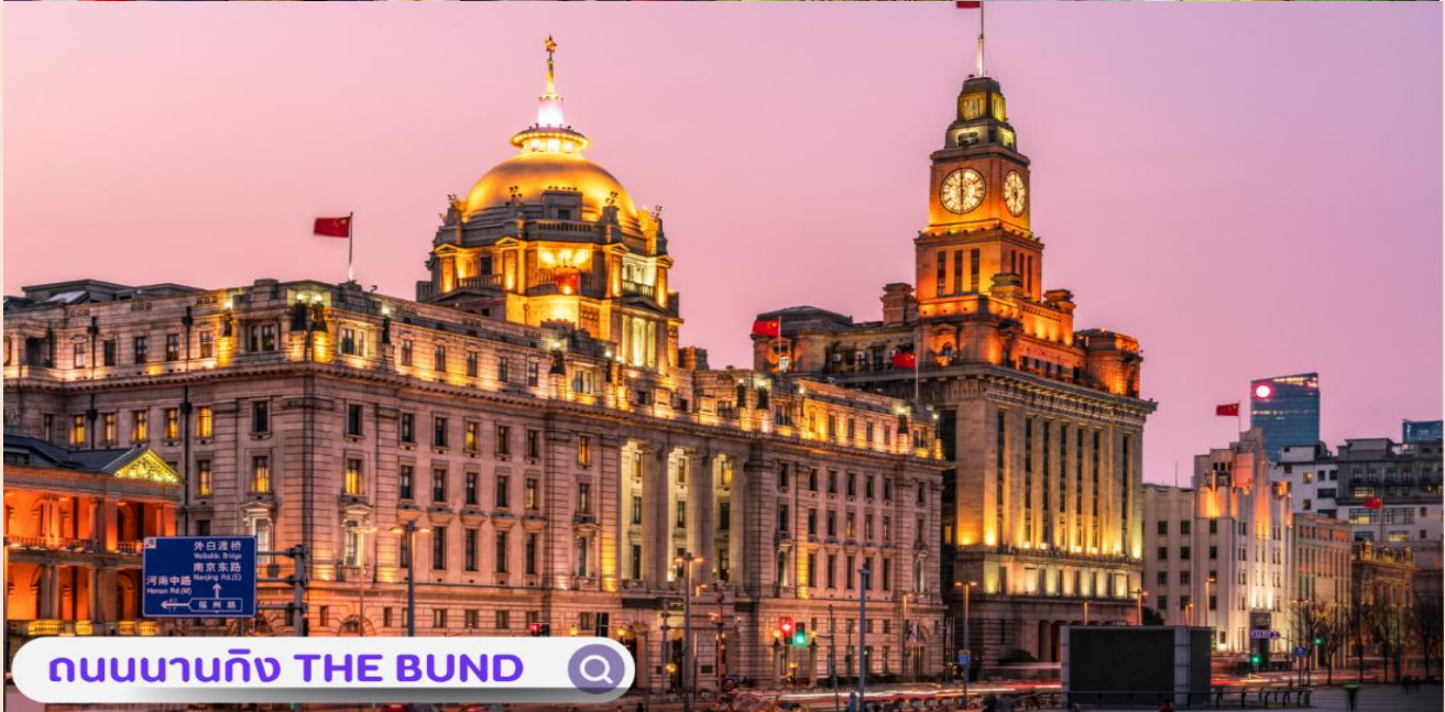
ถนนนานกิง THE BUND

จากนั้นอิสระท่านเพลิดเพลินที่ ถนนนานจิง(NANJING ROAD) เป็นย่านช้อปปิ้งเก่าแก่ที่สุดของเซี่ยงไฮ้ เป็นตลาดซื้อขายของกันคึกคักตั้งแต่ทศวรรษ 1920 ตั้งอยู่ฝั่งผู้ซีกินพื้นที่ยาวตั้งแต่ฝั่งตะวันตกของ “เดอะ บันด์” ถึง “พีเพิลส์ สแควร์” เป็นแหล่งช้อปปิ้งสินค้าแบรนด์เนมจากทั่วโลก และยังเป็นศูนย์รวมร้านค้าและร้านอาหารอีกมากมาย และพลาดไม่ได้กับนักจุ่มอาร์ททอยอย่าง แบรินด์ POPMART GLOBAL FLAGSHIP STORE ร้านขายของเล่นที่เป็นที่โด่งดังในขณะนี้ไม่ว่าจะ LABUBU MOLLY SKULLPANDA และอย่างอื่นอีกมากมาย ให้ท่านได้เลือกลุ้นกับอย่างสนุกสนาน