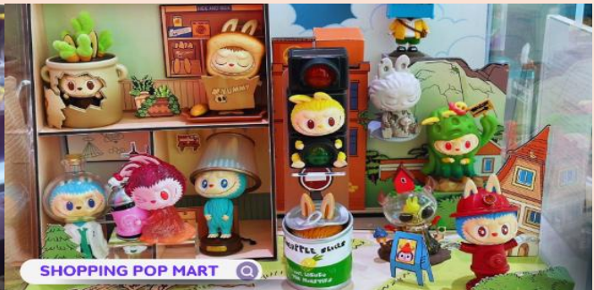
SHOPPING POP MART