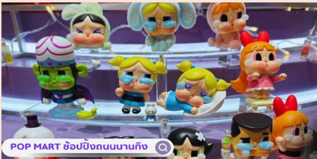
POP MART ซ้อปิ้งถนนนานกิง

ถ่ายรูปเมื่อมาถึงเมืองเซี่ยงไฮ้ นั่นคือ หอไข่มุก เป็นหอส่งสัญญาณวิทยุโทรทัศน์สูง 468 เมตร ลักษณะเป็นไข่มุก 11 ลูก และ เสา 3 เสา ด้านบนเป็นรูปไข่มุก 3 เม็ด 3 ขนาดเรียงกันในแนวตั้งไม่ขึ้นตึก นำท่านถ่ายรูป ตึกเซี่ยงไฮ้ทาวเวอร์ (Shanghai Tower) เป็นอาคารสูงที่ตั้งอยู่ในเขตภูมิศาสตร์เศรษฐกิจและการการเงินของเซี่ยงไฮ้ ประเทศจีน ซึ่งเป็นอาคารสูงที่สูงที่สุดในประเทศจีนและอันดับสองของโลก หลังจากอาคารบูรณาการบูรณสูงที่สุดในโลก ในดูไบ ตลอดจนเป็นที่รู้จักกันดีในทศวรรษของทุกส่วนของโลกสูงเป็น 632 เมตร (2,073 ฟุต) และมีจำนวนชั้นทั้งหมด 128 ชั้น ไม่ขึ้นตึก นำท่านเดินทางสู่ NORTH BUND GREEN LAND สวนสาธารณะสุดปังริมน้ำ ที่มุมถ่ายรูปจึ้งมาก พื้นที่สีเขียวริมแม่น้ำฝั่งเหนือของ The Bund ท่านจะเห็นวิวของหอไข่มุกทิศตะวันออก เป็นแนวคิดที่ทำให้เมืองมหานครที่ทันสมัย และยังใหญ่อย่างเซี่ยงไฮ้ให้ดูมีสีสันสบายตาตัดผสมผสานกับธรรมชาติได้อย่างลงตัว ทำให้แลนด์มาร์คแห่งนี้กลายเป็นจุดเช็คอินที่ทั้งคนพื้นที่ และนักท่องเที่ยวต่างพากันมาถ่ายรูปอย่างไม่ขาดสาย นำท่านสู่บริเวณ หาดไวทาน (WAITAN) ซึ่งไม่ได้เป็นหาดทรายชายทะเลแต่อย่างใด แต่เป็นย่านถนนริมแม่น้ำที่มีความยาว 1.5 กิโลเมตร ไปตามริมแม่น้ำหวงผู่ฝั่งตะวันตกซึ่งอยู่ในย่านเมืองเก่า หาดไวทานยังคงเคยเป็นสถานที่ถ่ายทำภาพยนตร์ที่โด่งดังเรื่อง “เจ้าพ่อเซี่ยงไฮ้”