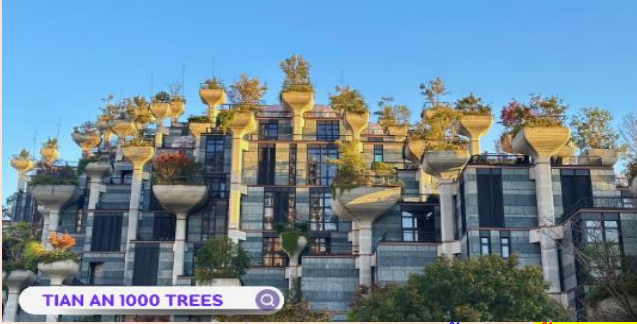
TIAN AN 1000 TREES