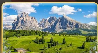
ชมวิอลังการ alpe di siusi