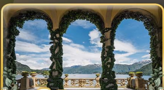
เช็กอิน Villa del Balbianello

ที่สุดของธรรมชาติแห่งอิตาลี ทิวเขา ทะเลสาบ ความงามแห่งไดโลไนท์