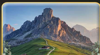
เยือน Passo Giau