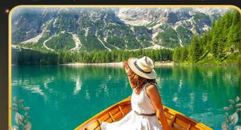
พายเรือทะเลสาบ Braies