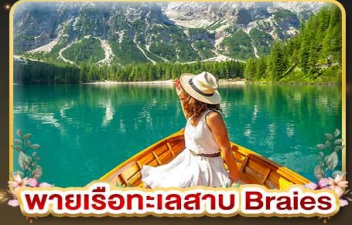
พายเรือทะเลสาบ Braies