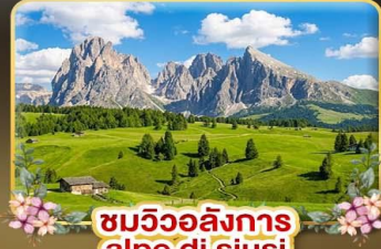
ชมวิวลังการ alpe di siusi