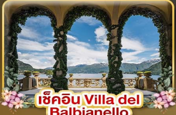
เชคอิน Villa del Balbianello

ที่สุดของธรรมชาติแห่งอิตาลี ทิวเขา ทะเลสาบ ความงามแห่งโดโลไมท์