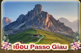
เยือน Passo Giau