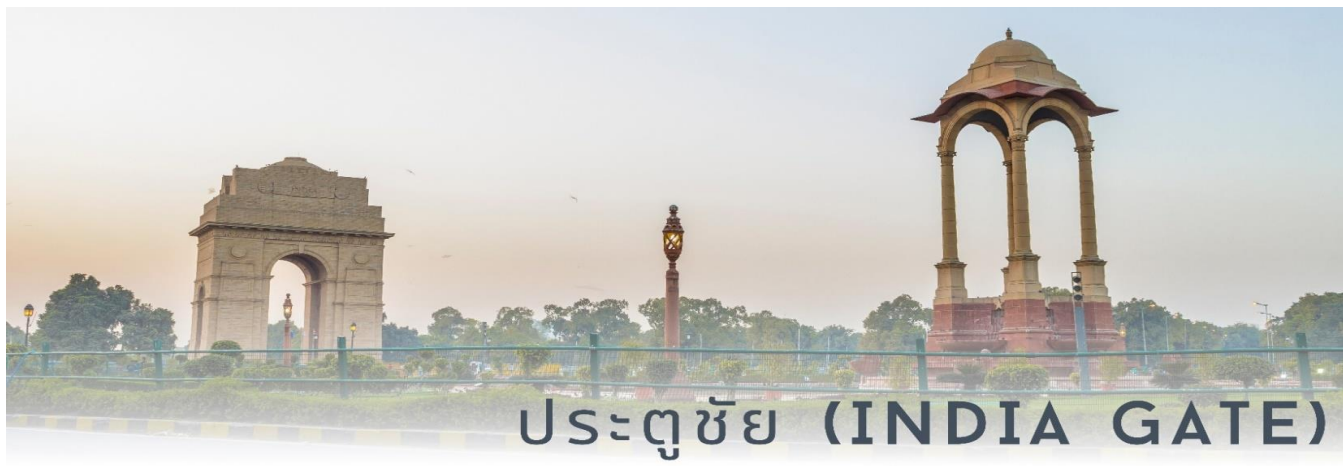
ประตูชัย (INDIA GATE)

จากนั้นนำท่านผ่านชม ประตูชัย (India Gate) เป็นอนุสรณ์สถานของเหล่าทหารหาญที่เสียชีวิตจากการร่วมรบกับอังกฤษในสมัยสงครามโลก ครั้งที่ 1 และสงครามอัฟกานิสถาน ประตูชัยแห่งนี้จึงถือได้ว่าเป็นสัญลักษณ์แห่งหนึ่งของกรุงนิวเดลี โดยซุ้มประตูแห่งนี้มีสถาปัตยกรรมคล้ายประตูชัยของกรุงปารีสและนครเวียงจันทน์ ซึ่งมีความสูง 42 เมตร สร้างขึ้นจากหินทรายเมื่อปีคริสต์ศักราชที่ 1931 ในอาณาบริเวณนี้ มีอีกหนึ่งสถานที่สำคัญที่สุดในอินเดีย คือ Rajpath ถนนราชปาด แปลว่า "ทางของกษัตริย์" เป็นถนนสำหรับประกอบพิธีกรรมที่ใช้ในช่วงวันสาธารณรัฐทุกปี ถนนสายนี้ตั้งอยู่บริเวณใจกลางเมืองเดลีและทอดยาวจากราชปถีกาวันผ่านวิเจย์ โชคและประตูอินเดีย ทำให้เดินทางไปมาได้สะดวกจากทุกมุมของเมืองหลวงเป็นสถานที่ตั้งของ ธรรมเนียมรัฐบาลของอินเดีย มีทหารยามเฝ้าตลอดเวลาเพื่อป้องกันการก่อวินาศกรรม