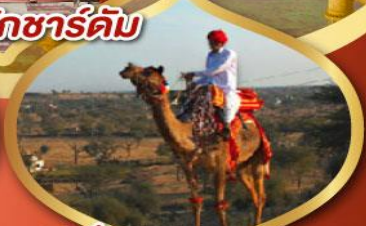
ฟรี ขี่อูฐ เมืองมันทวา ราคาเริ่มต้น