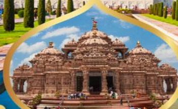
วิหารอักซาร์ดีม