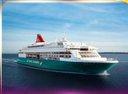
เรือสำราญ GO NORDIC CRUISE LINE