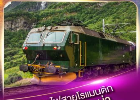
รถไฟสายโรเมนติก ฟลัมส์บาน่า