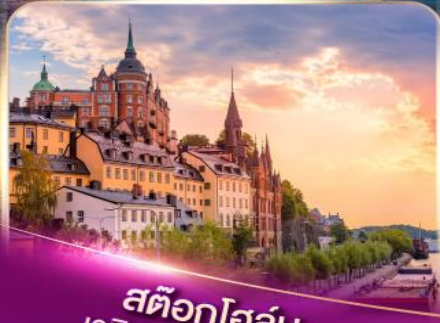
สต็อกโฮล์ม เวนิสแห่งยุโรปเหนือ