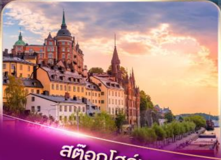
สต็อกโฮล์ม เวนิสแห่งยุโรปเหนือ