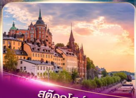
สต็อกโฮล์ม เวนิสแห่งยุโรปเหนือ