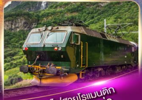
รถไฟสายโรเมนติก ฟลัมส์บาน่า