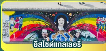
อีสไซด์เกาลอรี่