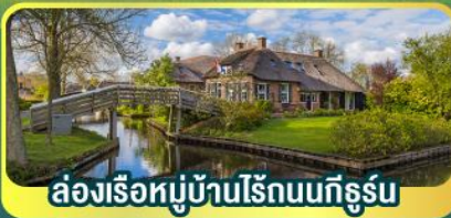
ส่องเรือหมู่บ้านไรถนนทีรูรัม