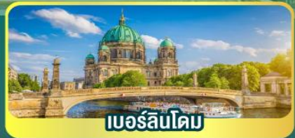
เบอร์ลินโดม