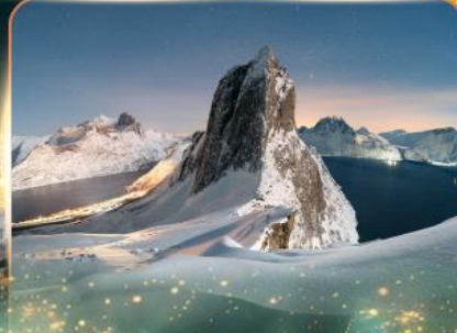
เกาะเซนญา