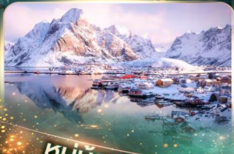
หมู่บ้านเรนเน

นอร์เวย์ แสงเหนือสุดฟิน เชคอินสุดว้าว 10 วัน 7 คืน