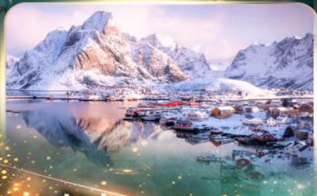
หมู่บ้านเรนเน

นอร์เวย์ แสงเหนือสุดฟิน เซ็คอินสุดว้าว 10 วัน 7 คืน