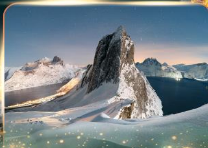
เกาะเซนญา