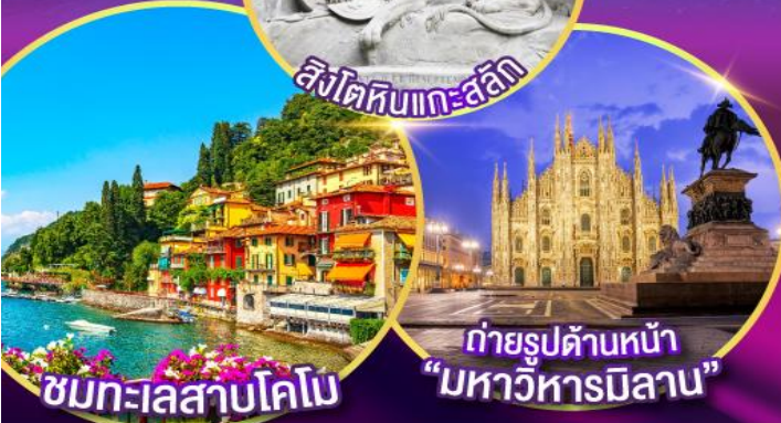
ชมทะเลสาบโคโม