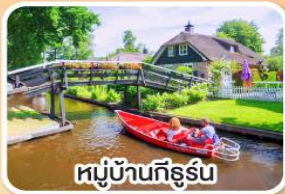
หมู่บ้านกังธูร์น