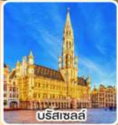
บริสเซลส์