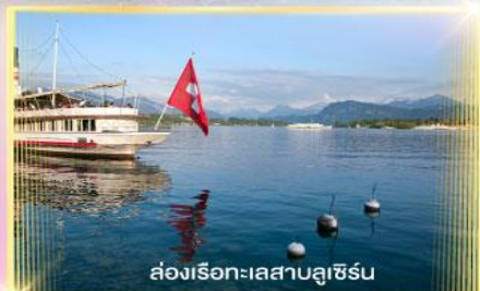
ส่องเรือทะเลสาบลูเซิร์น