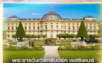
พระราชวังแวร์ทซ์บวร์ค เรสซิเดนซ์