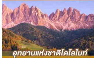
อุทยานแห่งชาติโดโลไมท์

บินตรงนครอัมสเตอร์ดัม กับเส้นทางสายโรแมนติก พร้อมการแสดงพื้นบ้านสไตล์ที่โรเลียนสุดพิเศษ