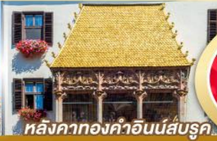
หลังคาทองคำอินน์ส์บรุค