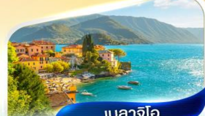
เบลลาจีโอ