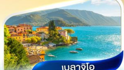
เบลลาจีโอ