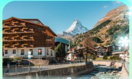
เซอร์มีแมท