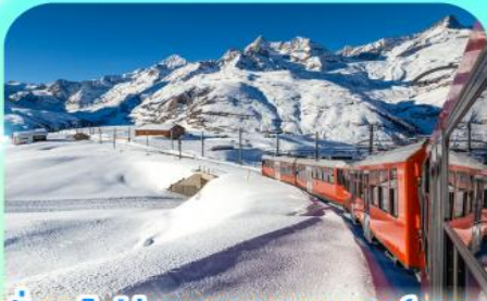
นั่งรถไฟสู่ยอดเขารอนเนอส์เกรต

สวยสะท้านฟ้าที่สวิสฯ สะกิดรักที่โดมโบ พิชิตเขาแมทเทอร์ฮอร์นและจุงเฟรา