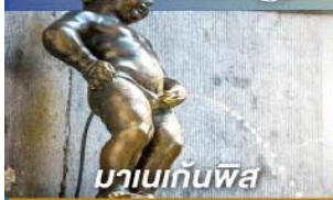
มานเนกันพิส