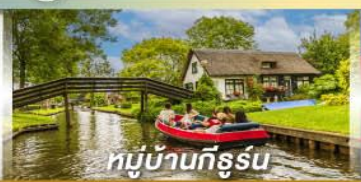
หมู่บ้านทึร์รูน