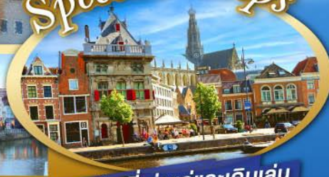
ชมเมืองที่เก่าแก่และเดินเล่น ย่านเมืองเก่าสุดคลาสสิก