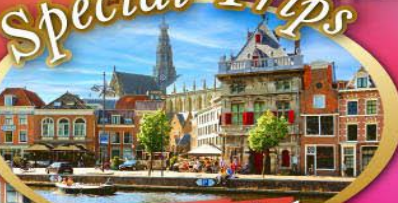
เก็บครบเบเนลักซ์ แวะเที่ยวฮาร์เล็ม