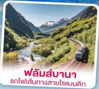
ฟลิ้มส์บานา รถไฟเส้นทางสายโรแมนติก