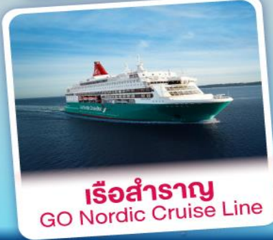
เรือสำราญ GO Nordic Cruise Line