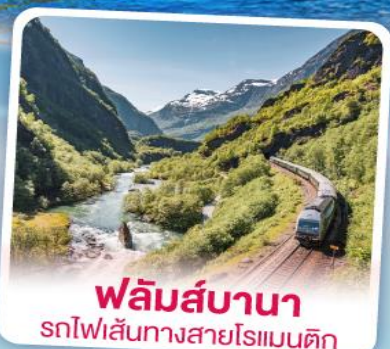
ฟลิคส์บานา รถไฟเส้นทางสายโรแมนติก