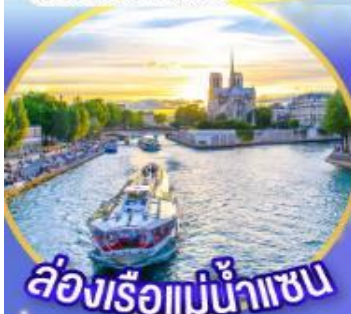
ล่องเรือแม่น้ำเซน